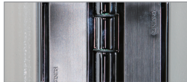
铝合金静音铰链, 坚固无异响。