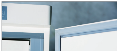
磁性门封条, 确保外门与箱体的密封。