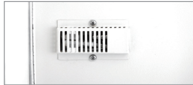
箱内温度传感器相对固定并且外加防护罩, 避免与箱体或者存储物品接触导致监测失真。