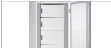
独立内门使得开门时冷空气泄漏量最小。